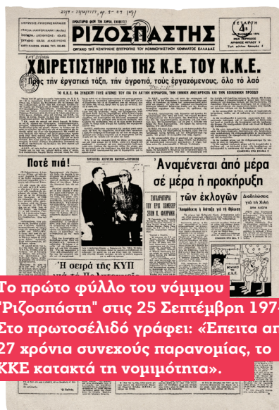
Το πρώτο φύλλο του νόμιμου "Ριζοσπάστη" στις 25 Σεπτεμβρίου 1974. Στο πρωτοσέλιδό γράφει: «Επειτα από 27 χρόνια συνεχούς παρανομίας, το ΚΚΕ κατακτά τη νομιμότητα».

Από την πλευρά του, το αστικό πολιτικό σύστημα, στην προσπάθεια αναμόρφωσής του, δεν μπορούσε να αγνοήσει την υποχώρηση του αντικομμουνισμού στις εργατικές - λαϊκές δυνάμεις, στην οποία άθελά της συνέβαλε και η δικτατορία, ταυτίζοντας κάθε αμφισβήτησή της με «κομμουνιστικό δάκτυλο»