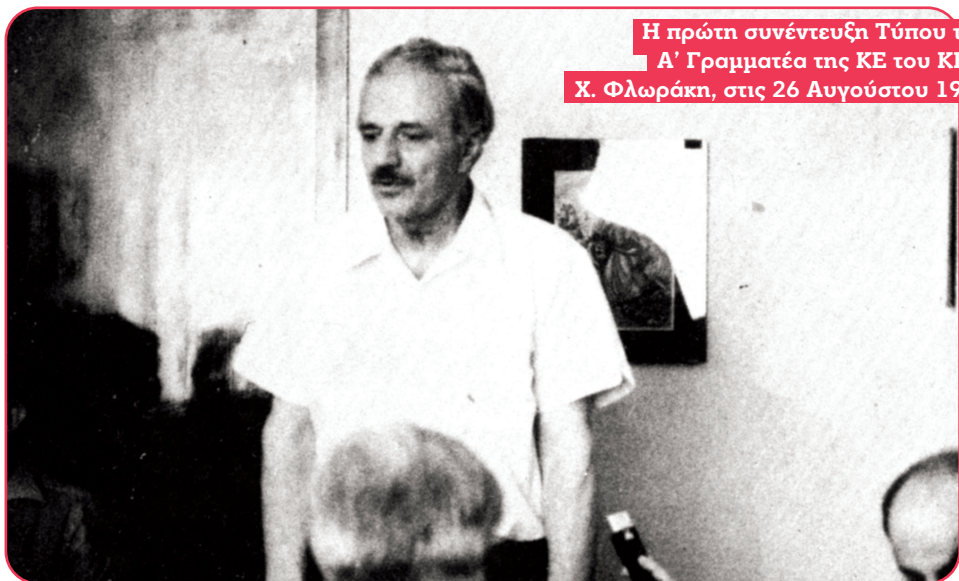
Η πρώτη συνέντευξη Τύπου του Α΄ Γραμματέα της ΚΕ του ΚΚΕ, Χ. Φλωράκη, στις 26 Αυγούστου 1974