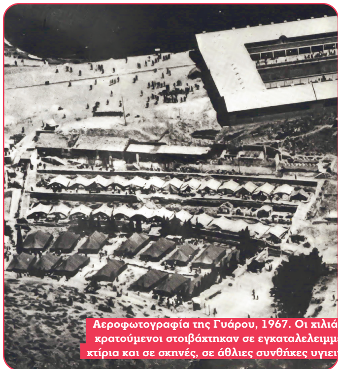
Αεροφωτογραφία της Γυάρου, 1967. Οι χιλιάδες κρατούμενοι στοιβάχτηκαν σε εγκαταλελειμμένα κτίρια και σε σκηνές, σε άθλιες συνθήκες υγιεινής

Χρειάστηκε να περάσει αρκετός χρόνος μέχρι να εκδηλωθούν τα πρώτα μαζικά σκιρτήματα αντίδρασης, κύρια σε χώρους φοιτητών και σπουδαστών. Στη συνέχεια, στο πλαίσιο «φιλελευθεροποίησης» του χουντικού καθεστώτος, η σταδιακή απελευθέρωση πολιτικών κρατουμένων επέτρεψε την ποσοτική μεγέθυνση και την ποιοτική βελτίωση των Κομματικών Οργανώσεων. Αλλά και η καπιταλιστική οικονομική κρίση του 1973 συνέβαλε στην ανάπτυξη αγώνων των εργατικών - λαϊκών δυνάμεων, φτάνοντας στην κατάληψη της Νομικής και στον ξεσηκωμό του Πολυτεχνείου, όπου στο πλευρό των αγωνιζόμενων φοιτητών συσπειρώθηκαν εργατοϋπάλληλοι και λαϊκά μεσαία στρώματα. Σε αυτές τις κινητοποιήσεις σημαντική ήταν η παρέμβαση του ΚΚΕ και της ΚΝΕ.